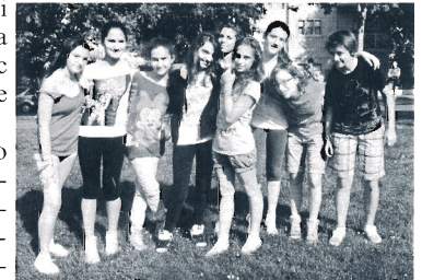
Ragazzi in posa all'Amalfy Party