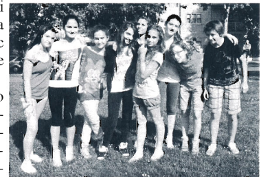
Ragazzi in posa all'Amalfy Party

Piazza Giordano Bruno di Montignano - domenica 24 giugno 2012 - ore 21,00